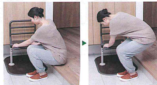
玄関などの立ち上がりと昇降をサポート