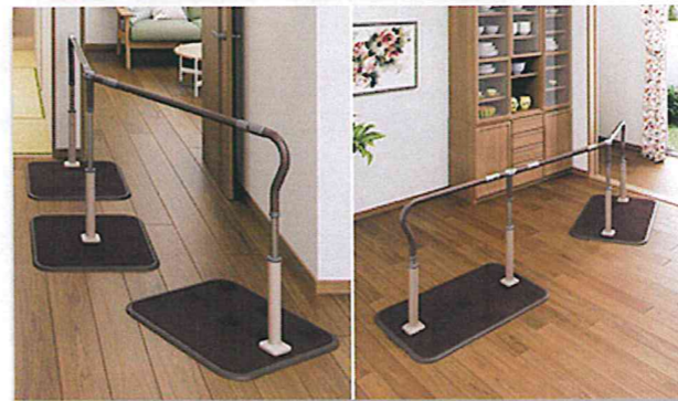
長いアプローチの廊下や部屋の移動にも