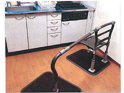
台所でも立ち上がり と移動をサポート