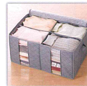
トップスはまとめて収納

誰も好みの色があり、偏ったスタイリングをしてしまいがちです。それがわかれば衣替えの時に似たものを集めて、その中で一番傷んだり色褪せたりしたものは処分して、来季は綺麗な衣類だけでスタートすると気持ちが良いものです。