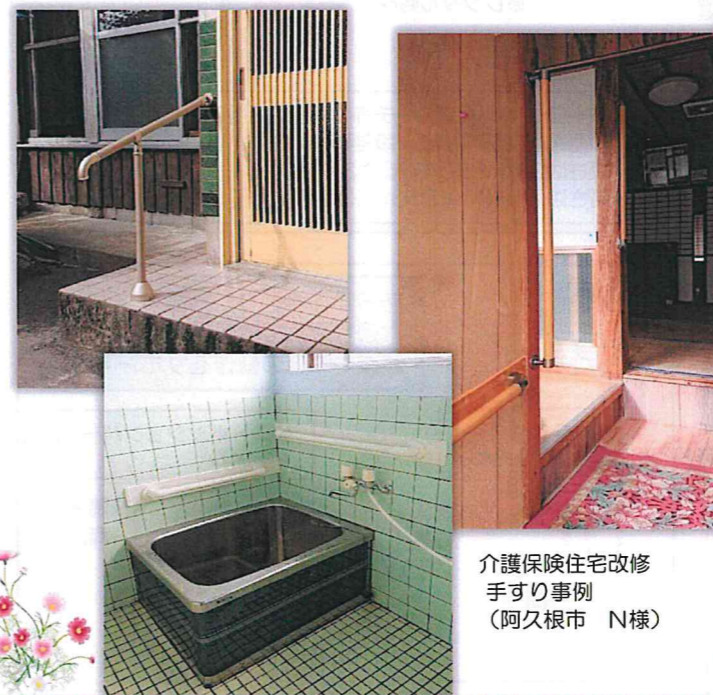
介護保険住宅改修 手すり事例 (阿久根市 N様)

それによって得られる 「自分が望む、心地よい暮らし」 の実現と、その先にある 「生きがい」「生きることは喜び」 へと繋がっていくことが 私たちの喜びです。 これからは暖家のできることを 誠心誠意、誠一杯。 大切なあなたと、そのご家族のために。