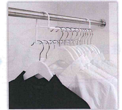
ハンガーを統一すると使い勝手も見た目もすっきり！

若い時に着ていた派手なデザイン、短い丈のスカート、引き締まったデザインなど数十年も着ていない服は、現在の自分のサイズや顔写りに合っているでしょうか？長く着ていない服は一度着用すると『また着るか、着ないか』を明確に決めることが出来ます。