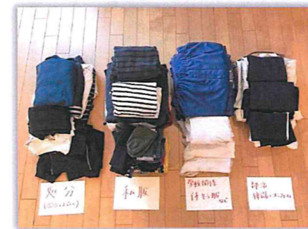
子供の服も自分たちで、要・不要を決める習慣を

できれば衣類整理は年2回、時間を作って住んでいる家族全員で実行することが大切です。年2回は衣替えのタイミングがピッタリです。今シーズン、着たのか、着なかったのかをチェックし、大事なことは、着なかった衣類をそのまま放置しないこと。ライフスタイルや職業が変わると、着なくなる衣類も多くあります。そしてその際にマフラーや帽子、アクセサリやバック、靴下等も整理する。同じ頃合いにそれらを片付けると、コーディネートも考えやすいからです。