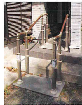
(暖家事例の一部です)

その原因は玄関や出入口にあるのでは? 安全に安心して出入り・移動できるように「出かけてみよう!」と思える、手すり設置はとても大切です。まずはご相談ください。