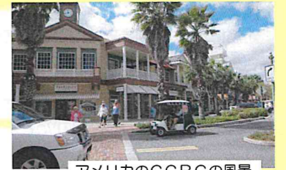
アメリカのCCRCの風景

（継続的なケア付きの高齢者たちの共同体） 仕事をリタイアした人が第二の人生を健康的に楽しむ街として米国で生まれた概念。 元気なうちに地方に移住し、必要な時に医療と介護のケアを受けて住み続けることができる場所を指す。