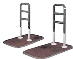
クリンティ (パナソニック)

据置型は主に寝返りや起き上がり時、手すりに掴まることで起居動作の安全性を高めたり、椅子やソファ、布団からの立ち上がりを補助します。