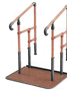
あがりまち用たちあっぱ (ステップ付き) (矢崎化工)

玄関のあがりまちや履き出し窓など上り下りの為のステップ台がついて安全に昇降できます。玄関などの手すり工事を避けたい等住宅事情にも対応できて安心です。