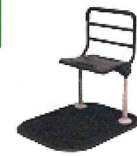
スタンディ (パナソニック)

玄関での立ち座りや布団、ベッドからの起き上がりの際、棒状の手すりではしっかりと握れない人でも面手すり部分に身体を預けられる。高さ35~50cmの間で6段階に調節可能。