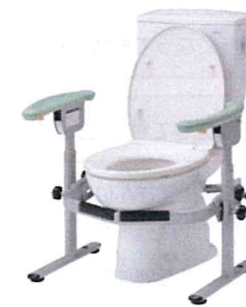
トイレフレーム (パラマウントベッド)

便器から立ち上がる際、両腕を使ってプッシュアップができるので片側の壁にある、棒状の手すりを握って立ち上がることが困難な方に有効です。また、便器と壁が離れていて手すりが取り付けにくい場合にも役立ちます。