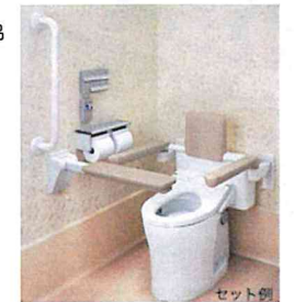
トイレ用手すり,前方ボード (はね上げタイプ) (TOTO)