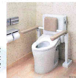
トイレ用手すり (はね上げタイプ) (TOTO)

排泄時間が長い方や、排泄しやすい前傾姿勢が必要な方のため、動作・姿勢を安定させる手すりです。